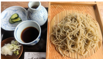
宮城県東和町にある挽きたて・打ち立て・ゆでたてが売りの「三たてそばの店」

私の味覚が鈍感なのか蕎麦の香りを感じられることが少ないのですが、そんな私でも蕎麦の香りを感じることができたお店が2店ありました。