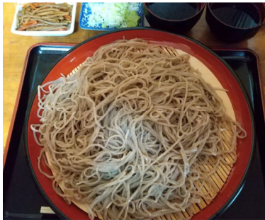
埼玉県皆野町にある蕎麦一本で勝負するつるつるしこしこの蕎麦屋。つつい特盛を注文してしまう。