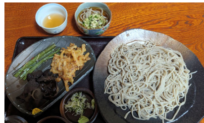
山形県大石田町次年子にある民家の仏間で食べる蕎麦屋。わらびの漬物も美味しい。