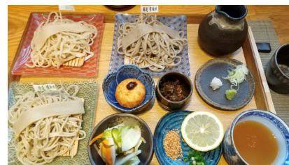
東京都あきる野市にある蕎麦好きが高じて、引退後に店を構えた蕎麦屋。アットホームで塩つゆが印象的。店主は蕎麦探訪系ユーチューバー。