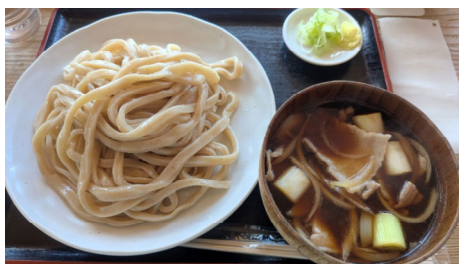
埼玉県川島町にあるアットホームな武蔵野うどんの名店。全粒粉を使い特に腰が強い麺が特徴。埼玉 S 級グルメ認定店

武蔵野うどんは埼玉県西部と東京都北西部を中心に多くの店があります。地場産の小麦粉を使用し太く腰が強い麺が特徴です。豚のばら肉を煮込んで具汁にした「肉汁うどん」が有名です。