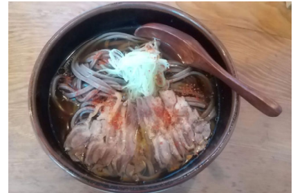
山形県河北町が発祥とされる「肉そば」

仕事で山形県に行った際に昼食で肉そばを食べたとき、親鳥の固くコリコリとした食感と優しい煮汁にはまったことがきっかけです。具材は茹でた親鳥のスライス、ネギ、そば、つゆなどシンプルです。B級グルメと言われていますが、店ごとにこだわりがあって面白い。私は冷たい肉そば派です。