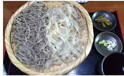
埼玉県日高市にある蕎麦屋。蕎麦は塩で味を確かめることを学んだ店。